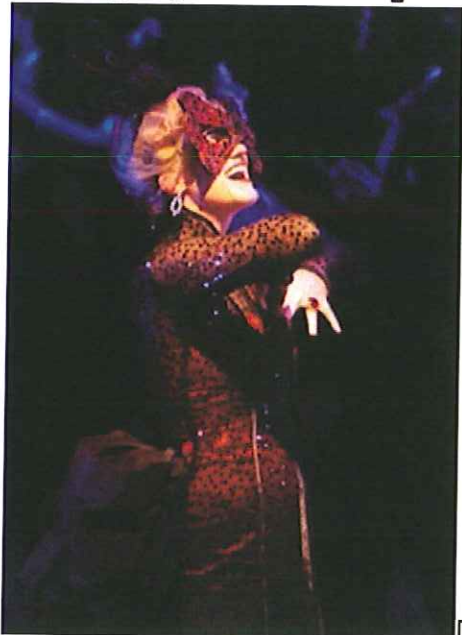
Die Fledermaus (Strauss, Boër - Strasbourg)